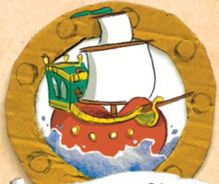
Poma dels Mars