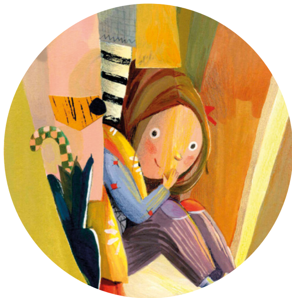
Ilustración Marta Fàbrega